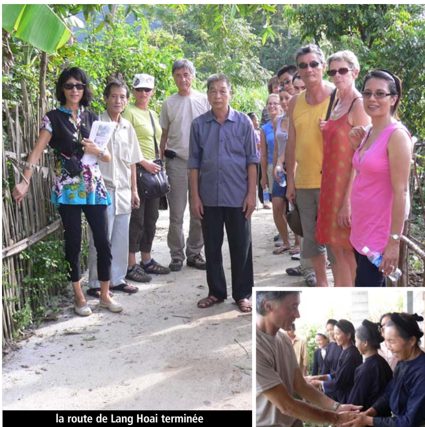
la route de Lang Hoai terminée

Une petite fête inaugurale était organisée à la maison communale et nous avons écouté le témoignage d'une habitante de 80 ans qui nous remerciait avec