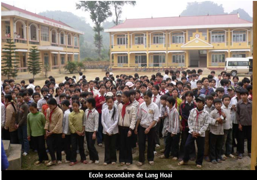
Ecole secondaire de Lang Hoai

Le cabinet médical est dirigé par un médecin assisté de deux infirmières et d'une aide-soignante. Il dispose de 4 lits pour les malades et de 2 lits pour les accouchements.