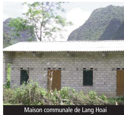
Maison communale de Lang Hoai