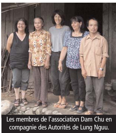
Les membres de l'association Dam Chu en compagnie des Autorités de Lung Nguu.