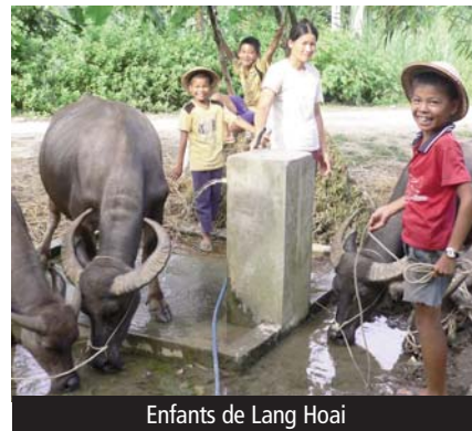
Enfants de Lang Hoai