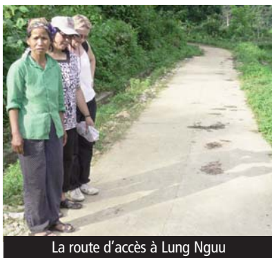
La route d'accès à Lung Nguu